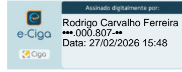
Rodrigo Carvalho Presidente